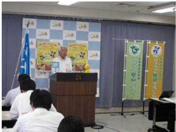
認証食品キャンペーン記者会見