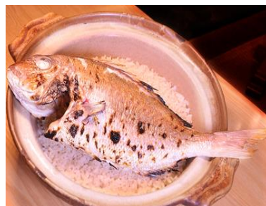
明石鯛を使用した土鍋天然鯛めし