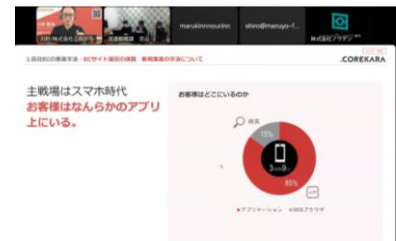
セミナーの様子(オンライン)