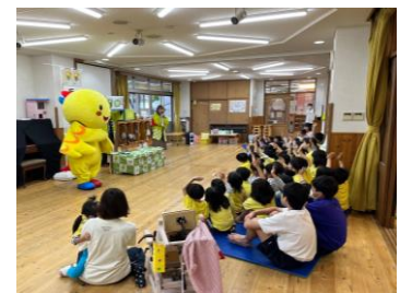
イベントの様子 (おかもと虹こども園)