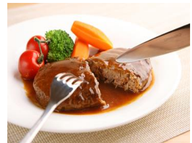
神戸ビーフと神戸ポークのハンバーグ