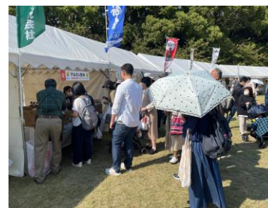
認証食品フェスティバルの様子

来場者にアンケートを実施、回答者の中から抽選で、兵庫県認証食品詰合せ（3,000円相当）をプレゼント。