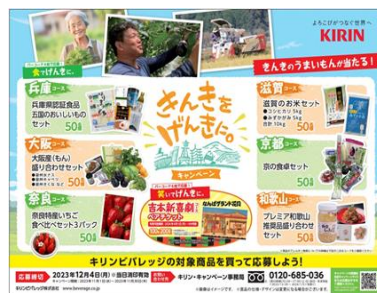
きんきをげんきに。キャンペーン