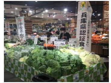
モデルショップの様子