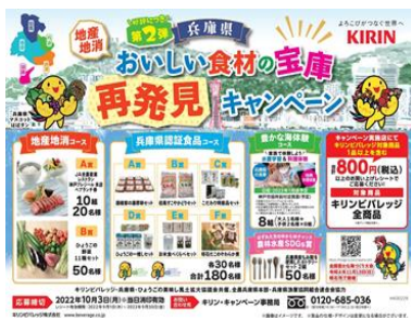
兵庫県おいしい食材の宝庫 再発見キャンペーン