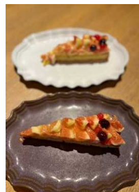
県産いちじくを使用したタルトフィグ