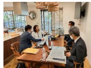
助言・指導の様子