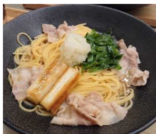
岩津ねぎのパスタ