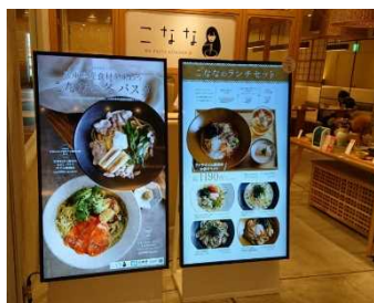
店頭でのデジタルサインズ掲示