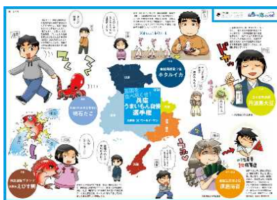
ランチョンマット