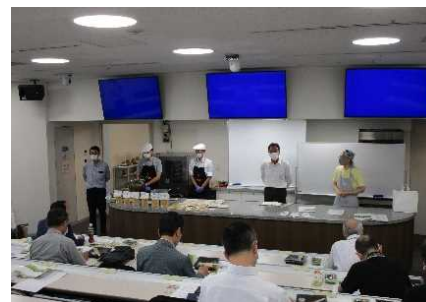
プレゼンテーションの様子

商品開発のヒントや新商品販売に向けてのアドバイスなど、食のトレンドや県産食材を熟知したプロからの指導を仰ぐ機会とする。