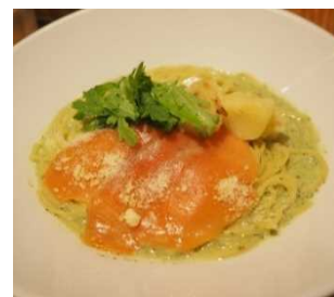
バジルクリームパスタ