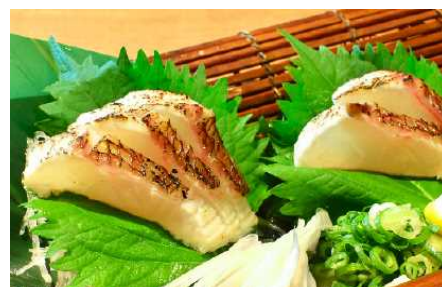
淡路島えびす鯛の薫焼き