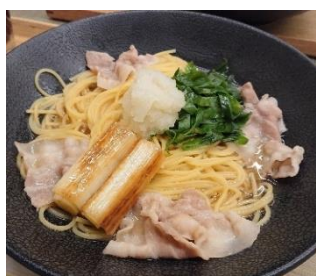
岩津ねぎのパスタ