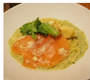
バジルクリームパスタ