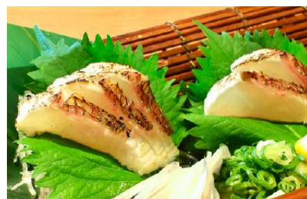
淡路島えびす鯛の薫焼き