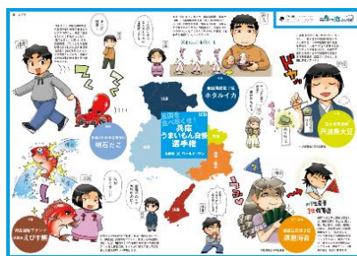
ランチョンマット