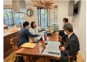
助言・指導の様子

ブランド化に取り組む産地のキーマンを育成する「ひょうご農畜水産物ブランド戦略スキルアップスクール」を開催し、商品企画開発・販売等に精通した講師が、参加事業者に、各商品のブラッシュアップや販路開拓に向けた助言・指導を実施。