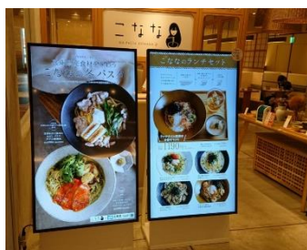
店頭でのデジタルメニュー掲示