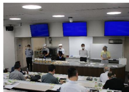
プレゼンテーションの様子

商品開発のヒントや新商品販売に向けてのアドバイスなど、食のトレンドや県産食材を熟知したプロからの指導を仰ぐ機会とする。