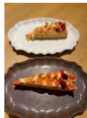
県産いちじくを使用したタルトフィグ