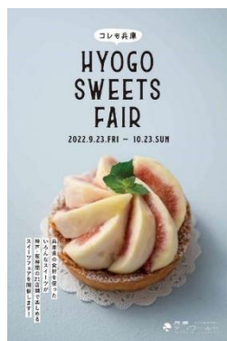
パンフレット表紙