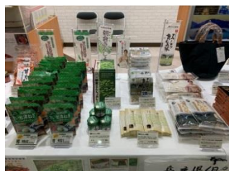
全 28 商品を販売