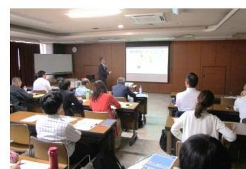
事業応募者向け事前セミナー