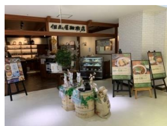
但馬屋珈琲店コピス吉祥寺店