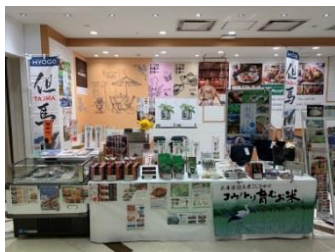
特産品販売の様子

オ 販売商品 コウノトリ育むお米、但馬牛、香住がに、ハタハタ、ホタルイカ、甘エビ、のどぐろ、カレイ、朝倉さんしょ、岩津ねぎ等