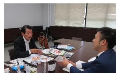
流通のプロからアドバイスを受ける事業者