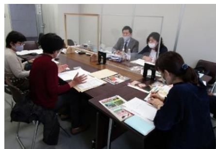
助言・指導の様子

ブランド化に取り組む産地のキーマンを育成する「ひょうご農畜水産物ブランド戦略スキルアップスクール」を開催し、商品企画・開発等に精通した講師が、参加事業者に、各商品のブラッシュアップや販路開拓に向けた助言・指導を行った。