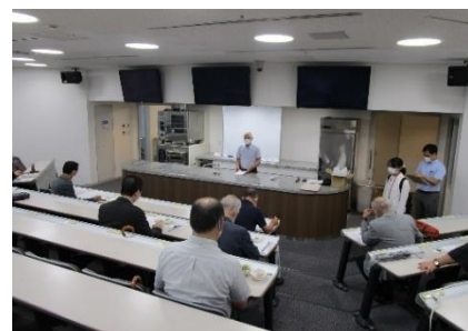
プレゼンテーションの様子

商品開発のヒントや、新商品販売に向けてのアドバイスなど、食のトレンドや県産食材を熟知したプロからの指導を仰ぐ機会とした。