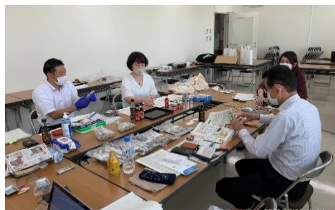
流通のプロとの個別面談の様子