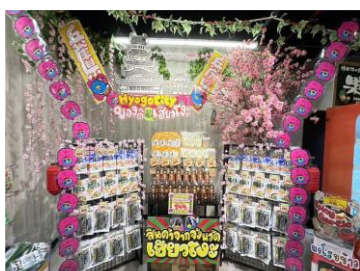
テスト販売の様子