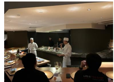
試食商談会の様子

ウ 参集者：シェフ11名、小売店バイヤー1名、日本食輸入卸バイヤー1名、現地輸入商社4名