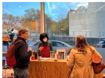
試食・試飲会の様子