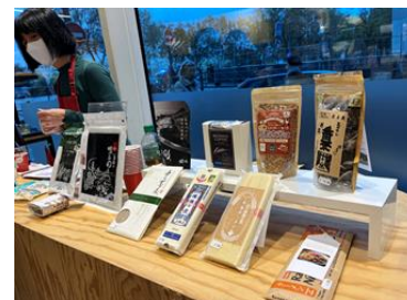
試食・試飲会の様子