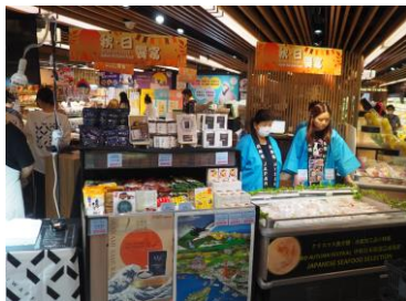
テスト販売の様子