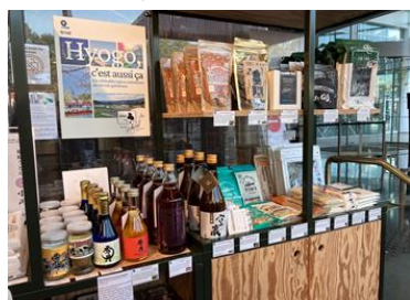
テスト販売の様子